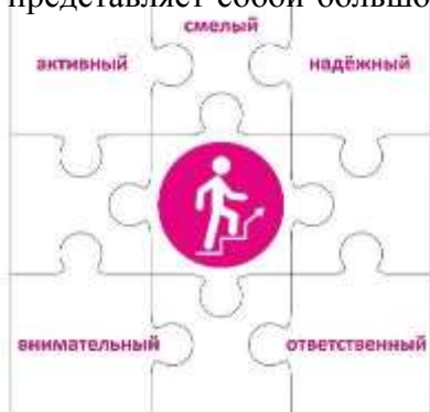
Конструктор «Лидер» 2 класс

Чтобы быть лидером, нужно много знать, уметь вести за собой, постоянно развиваться. Личность лидера многогранна, она словно складывается из множества разных пазлов, которые в целом дают яркую и интересную картинку. Конструктор «Лидер» представляет собой большой пазл, где центральный элемент – символ трека – человечек, поднимающийся вверх по лестнице. Остальные части этого пазла – элементы небольшого размера, примерно формата, на каждом из которых в левом верхнем углу написаны по одной букве из алфавита.