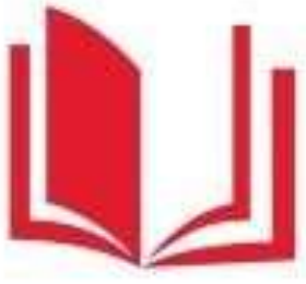
Логотип трека «Орлёнок – Эрудит»