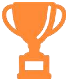
Логотип трека «Орлёнок – Спортсмен»

Ценности, значимые качества трека: здоровый образ жизни