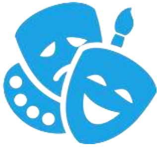
Логотип трека «Орлёнок – Мастер»

Трек «Орлёнок – Мастер» – 9 занятий Ценности, значимые качества трека: познание, творчество, красота