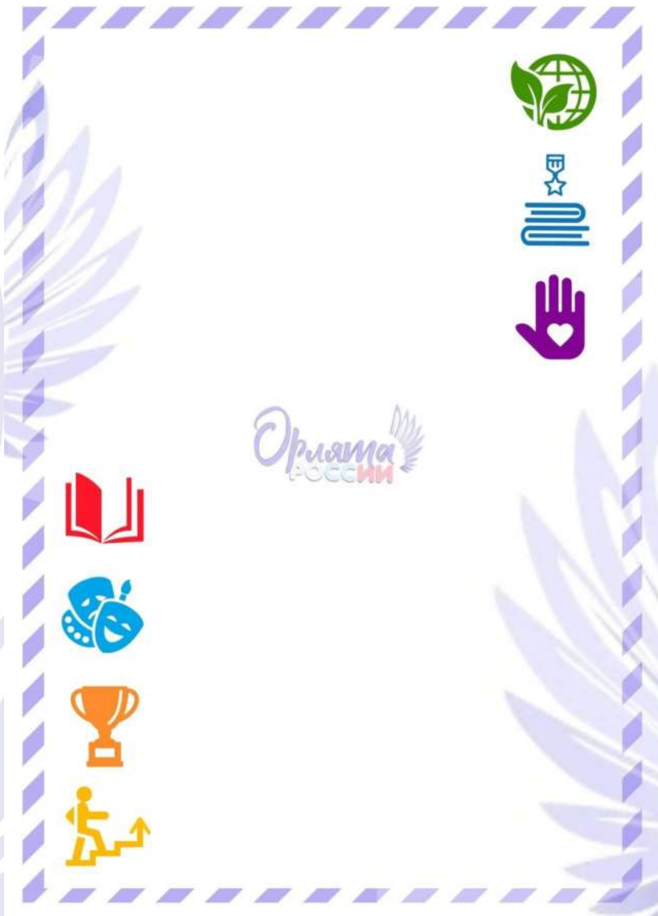
Рис. 2. Обратная сторона «Письма в Будущее».