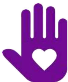
Логотип трека «Орлёнок – Доброволец»

Реализация трека проходит для ребят 1-х классов в начале декабря, но его тематика актуальна круглый год. Важно, как можно раньше познакомить обучающихся с понятиями «доброволец», «волонтёр», «волонтёрское движение». Рассказывая о тимуровском движении, в котором участвовали их бабушки и дедушки, показать преемственность традиций помощи и участия. В решении данных задач учителю поможет празднование в России 5 декабря Дня волонтёра.