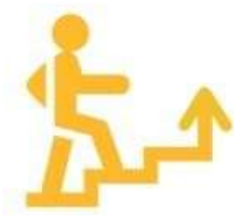
Логотип трека «Орлёнок – Лидер»

Ценности, значимые качества трека: дружба, команда