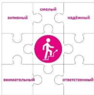
Конструктор «Лидер» 2 класс

Чтобы быть лидером, нужно много знать, уметь вести за собой, постоянно развиваться. Личность лидера многогранна, она словно складывается из множества разных пазлов, которые в целом дают яркую и интересную картинку. Конструктор «Лидер» представляет собой большой пазл, где центральный элемент – символ трека – человек, поднимающийся вверх по лестнице. Остальные части этого пазла – элементы небольшого размера, примерно формата, на каждом из которых в левом верхнем углу написаны по одной букве из алфавита.