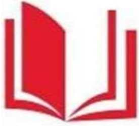
Логотип трека «Орлёнок – Эрудит»

Трек «Орлёнок – Эрудит» занимает первый месяц второй четверти, которая, чаще всего, отличается наличием различных олимпиад, интеллектуальных конкурсов, конференций и т.п. В этот период дети наиболее готовы знакомиться с разными способами получения информации, что необходимо для их успешной деятельности, в том числе познавательной. Именно в этот период учебного года у детей отмечается высокая мотивация и интерес к учёбе.