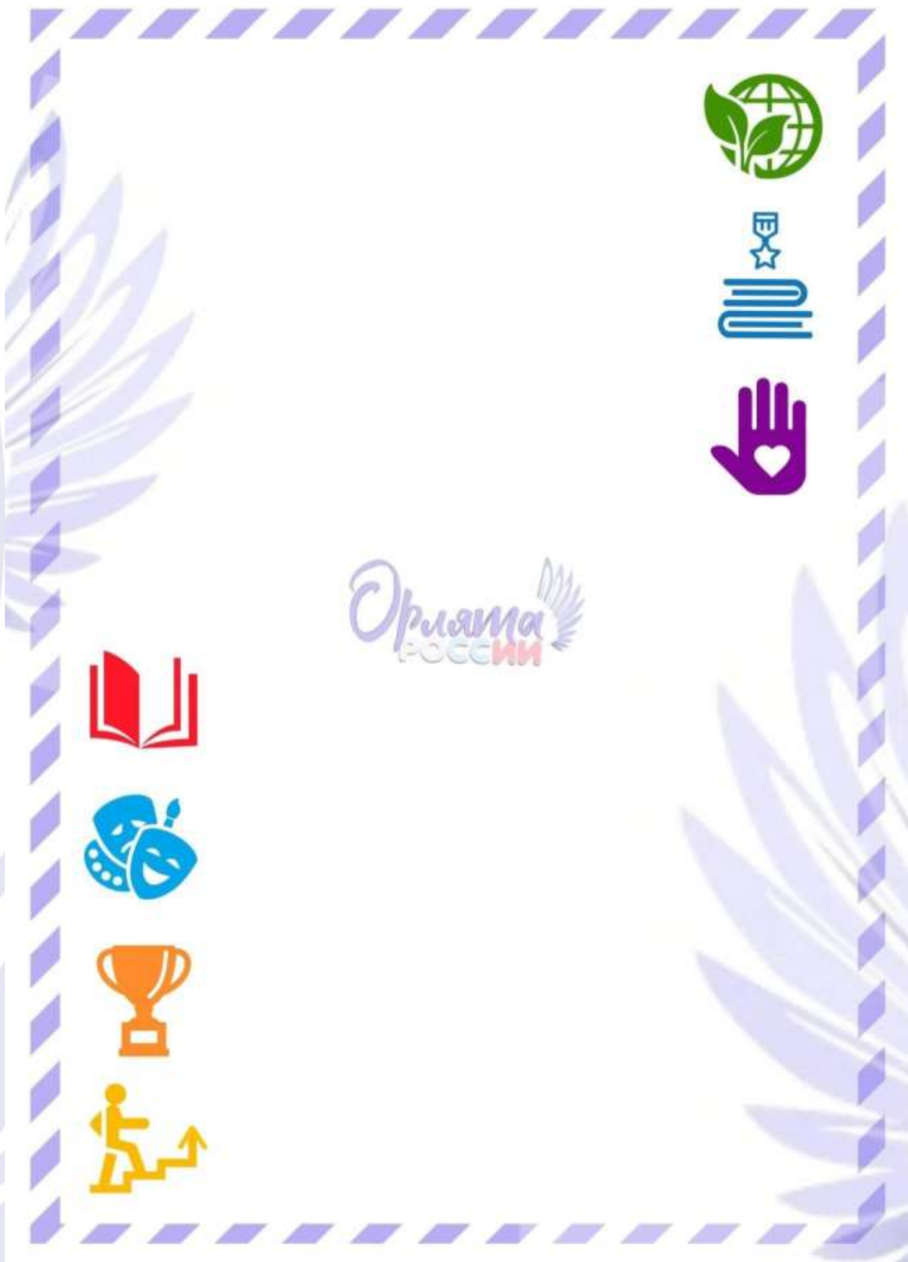
Рис. 2. Обратная сторона «Письма в Будущее».