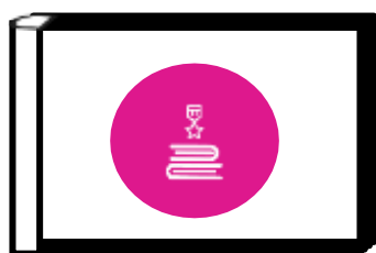
Альбом Хранителя исторической памяти

Данный трек является логическим завершением годового цикла Программы. В рамках трека происходит ценностно-ориентировочная деятельность по осмыслению личностного отношения к семье, Родине, к своему окружению и к себе лично. Ребёнок должен открыть для себя значимость сохранения традиций, истории и культуры своего родного края, через понимания фразы «Я и моё дело важны для Родины».