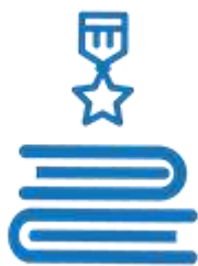
Логотип трека «Орлёнок –Хранитель исторической памяти»

Ценности, значимые качества трека: семья, Родина